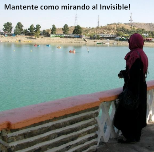
Mantente como mirando al Invisible!

Es maravilloso conocer lo que nuestro amado Padre Celestial hace en medio de esta nación. Recientemente oímos el testimonio de que una hermana estaba preparándose para compartir sobre el nacimiento de nuestro Salvador a una amiga. Esto se fue retrasando por diferentes motivos, pero la familia de la fe seguía clamando. Finalmente, la amiga tuvo un sueño donde veía a un “hombre de blanco” venir hacia ella y acariciarle la cabeza. Ella le preguntó al “hombre de blanco” quién era y él le contestó que en cuatro días ella iba a saber. Cuatro días después nuestra hermana le contó sobre Él!!!!.