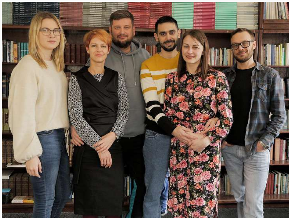
STAFF de este año en la Escuela

Por lo demás, todo va marchando bien. Yo sigo enseñando Evangelios Sinópticos, y planificando ya con vistas de lo que nos espera el año que viene. Para este mes de mayo tenemos algunos eventos y viajes ministeriales, y paralelamente a eso estamos trabajando en algunas mejoras para el edificio de la escuela, y en la escuela a distancia que les mencioné en cartas anteriores.