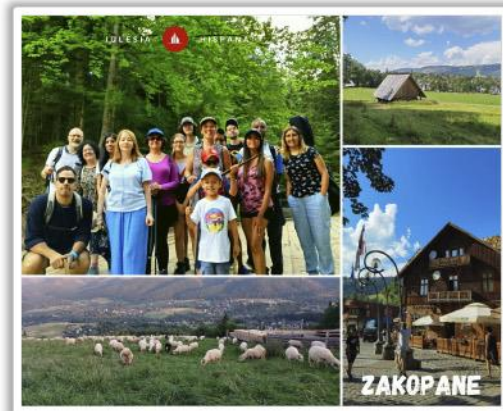
Retiro de la iglesia en Zakopane- sur de Polonia

Tenemos reuniones de jóvenes, de mujeres y de varones regularmente. Y para Febrero planeamos un Retiro de Invierno con el tema “La Familia” como centro, ya que entendemos que es necesario reforzar los valores cristianos frente a una sociedad que intenta con tanta fuerza imponer sus ideas tan alejadas de nuestra fe.