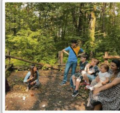
Trabajo con los niños