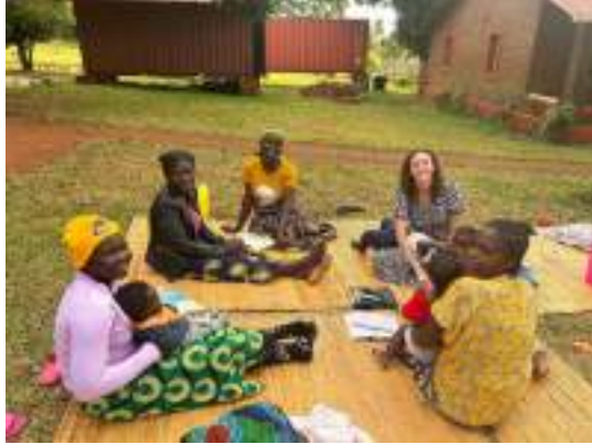
Foto: Leyendo juntas los evangelios y aprendiendo sobre las enseñanzas de Cristo.

En este momento estamos haciendo un plan de lectura sobre el libro de Mateo, con el fin de leer los 4 evangelios y profundizar sobre las enseñanzas de Cristo.