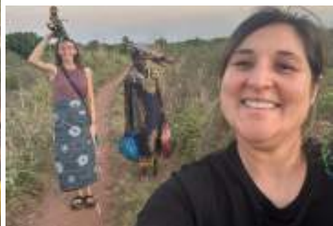
Fotos: realizando visitas a las mujeres y sus familias.