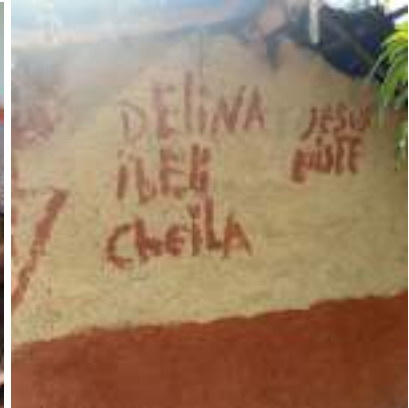
Pared de la casa de Adelina